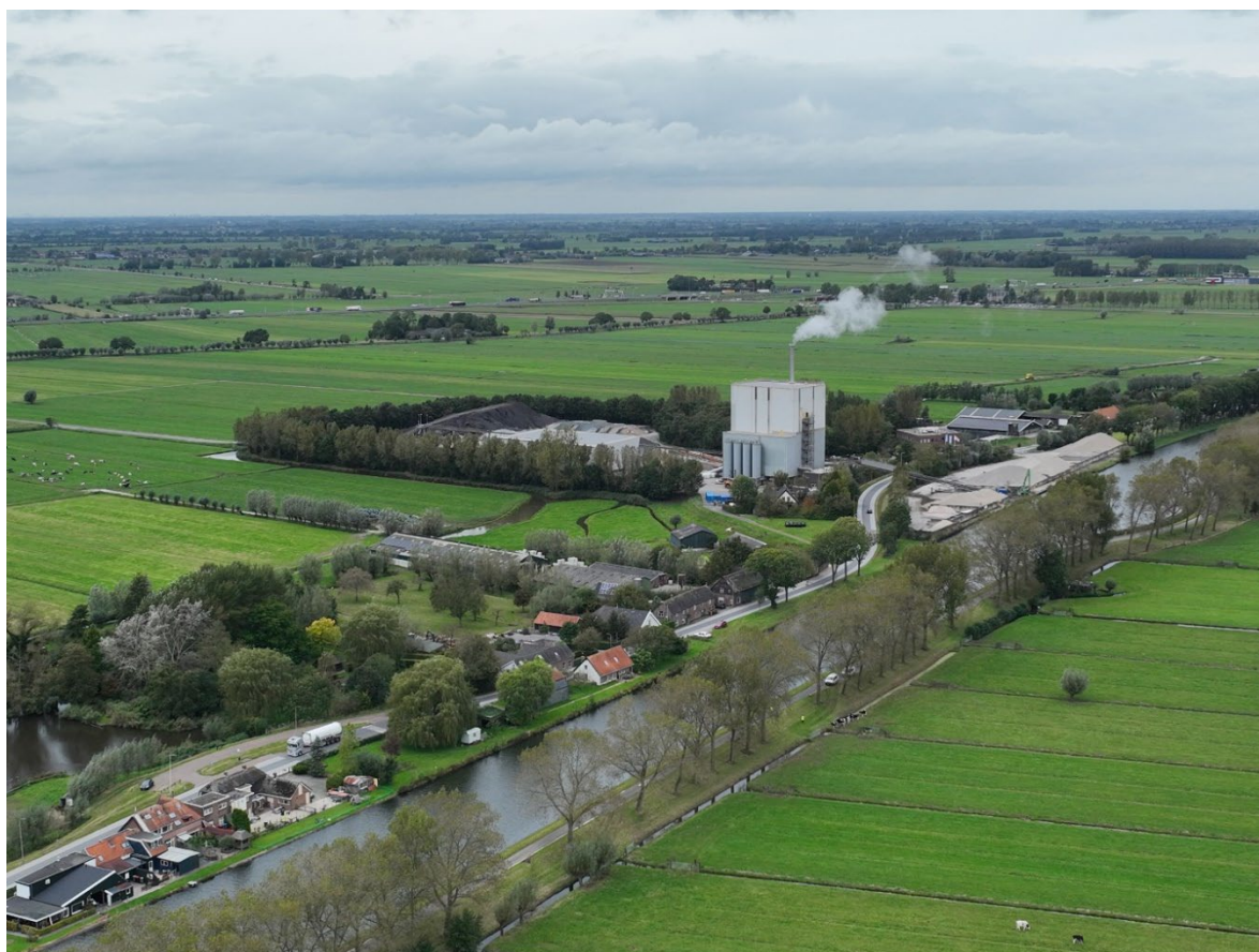
Figuur 1: APH met op de voorgrond lintbebouwing