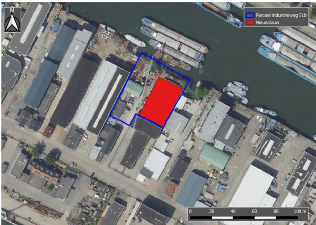
f 1.1 Perceel Visscher Scheepsreparatie B.V. aan de industrieweg 51b en de beoogde nieuwbouw

In opdracht van Visscher Scheepsreparatie B.V. (hierna Visscher) is onderzoek verricht naar geluid in de omgeving ten gevolge van de werkzaamheden en activiteiten op het perceel aan de Industrieweg 51b te Sliedrecht. Visscher is voornemens een nieuw gebouw te realiseren. Het bedrijf is gelegen op het industrieterrein 'Molendijk-Industrieweg'. Het perceel aan de industrieweg en de beoogde nieuwbouw zijn weergegeven in figuur f 1.1.