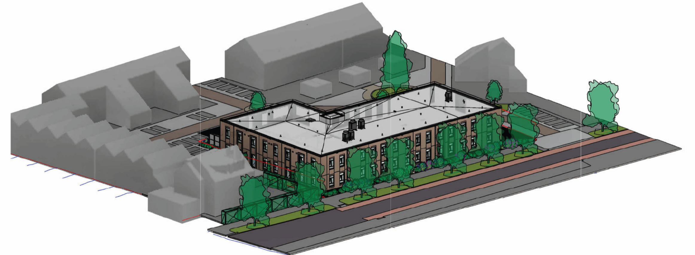
Noordwest overzicht 3D schaal