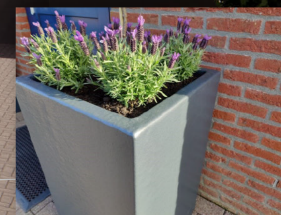
Perk Plantenbak op hoogte